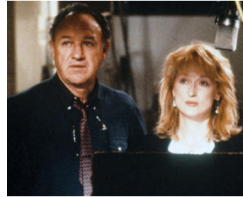
1989 BONS BAISERS D'HOLLYWOOD (Postcards from the edge) de M. Nichols avec Meryl Streep