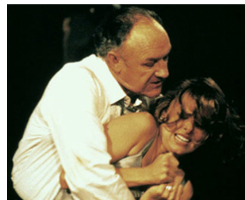
1997 LES PLEINS POUVOIRS (Absolute Power) de Clint Eastwood avec Melora Hardin