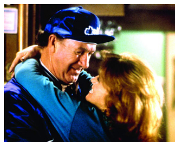
1984 SOLEIL D'AUTOMNE (Twice in a life time) de Bud Yorkin avec Ann-Margret