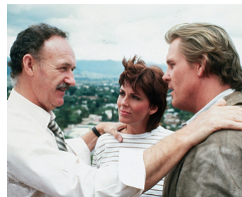
1982 UNDER FIRE (Under Fire) de Roger Spottiswoode avec Joanna Cassidy, Nick Nolte