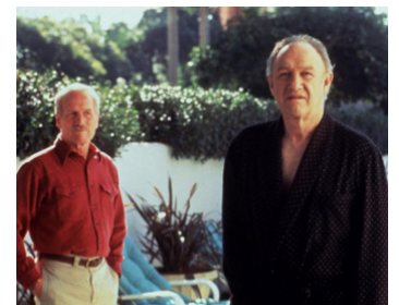
1997 L'HEURE MAGIQUE (Twilight) de Robert Benton avec Paul Newman