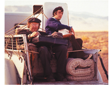
1972 L'ÉPOUVANTAIL (Scarecrow) de Jerry Schatzberg avec Al Pacino