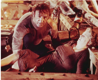
1972 L'AVENTURE DU POSÉÏDON (The Poseidon adventure) de R. Neame avec Shelley Winters