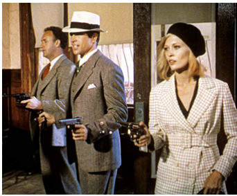
1967 BONNIE ET CLYDE (Bonnie and Clyde) d'A. Penn avec Warren Beatty, Faye Dunaway