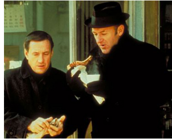
1971 FRENCH CONNECTION (The French Connection) de W. Friedkin avec Roy Scheider