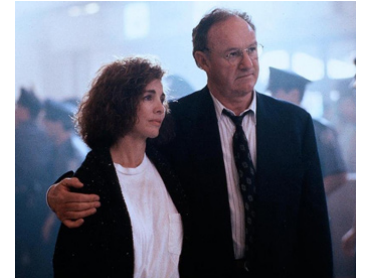
1990 LE SEUL TÉMOIN (The Narrow Margin) de Peter Hyams avec Anne Archer