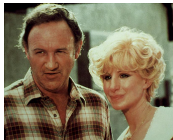
1980 LA VIE EN MAUVE (All Night Long) de Jean-Claude Tramont avec Barbra Streisand