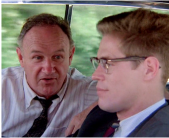
1988 MISSISSIPPI BURNING (Mississippi Burning) d'Alan Parker avec Willem Dafoe