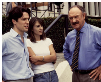
1996 MESURE D'URGENCE (Extreme Measures) de M. Apted avec Hugh Grant, Elizabeth Hurley