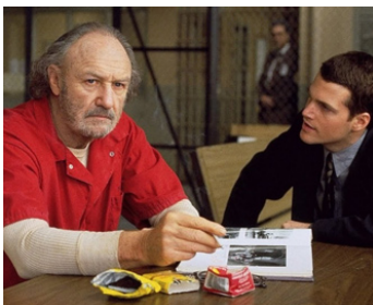
1996 L'HÉRITAGE DE LA HAINE (The Chamber) de James Foley avec Chris O'Donnell