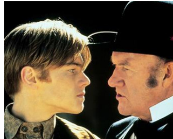
1994 MORT OU VIF (The Quick and the Dead) de Sam Raimi avec Leonardo Di Caprio