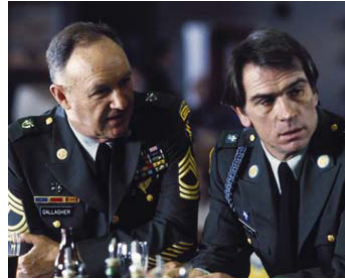
1989 OPÉRATION CRÉPUSCULE (The Package) d'Andrew Davis avec Tommy Lee Jones