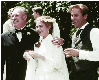
1993 WYATT EARP (Wyatt Earp) de Lawrence Kasdan avec Kevin Costner