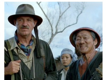
1983 RETOUR VERS L'ENFER (Uncommon Valor) de Ted Kotcheff avec Alice Lua, Kwan Hi Lim