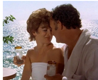
1976 LA THÉORIE DES DOMINOS (The Domino Principle) de S. Kramer avec Candice Bergen