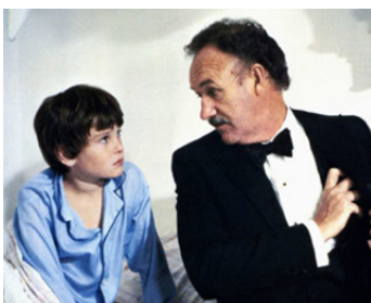
1983 BESOIN D'AMOUR (Misunderstood) de Jerry Schatzberg avec Henry Thomas