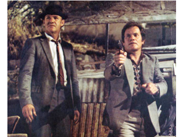
1974 FRENCH CONNECTION II de John Frankenheimer avec Bernard Fresson