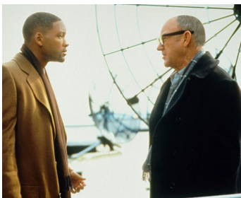
1997 ENNEMI D'ÉTAT (Enemy of the state) de Tony Scott avec Will Smith