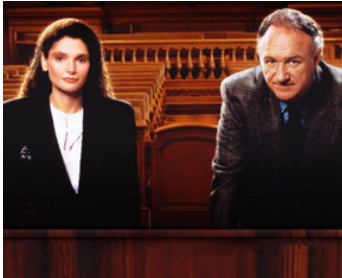
1990 AFFAIRES NON CLASSÉE (Class Action) de Michael Apted avec M. E. Mastrantonio