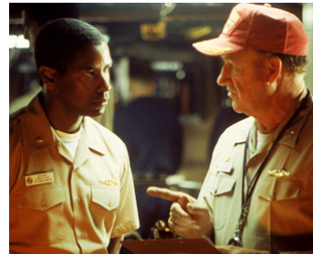
1994 USS ALABAMA (Crimson Tide) de Tony Scott avec Denzel Washington