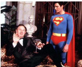
1978 SUPERMAN I et II (Superman) de Richard Donner avec Christopher Reeve