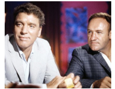
1969 LES PARACHUTISTES ARRIVENT (The Gypsy Moths) de J. Frankenheimer avec Burt Lancaster