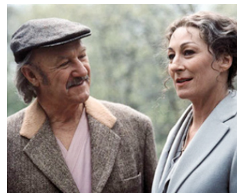
2001 LA FAMILLE TENENBAUM (The royal Tenenbaums) de Wes Anderson avec A. Huston