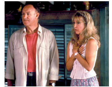
1988 PLEINE LUNE SUR BLUE WATER (Full Moon in Blue Water) de Peter Masterson avec Teri Garr