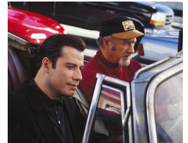
1995 GET SHORTY, STARS ET TRUANDS (Get Shorty) de Barry Sonnenfeld avec John Travolta