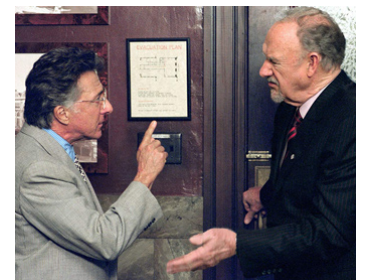
2002 LE MAÎTRE DU JEU (Runaway Jury) de Gary Fleder avec Dustin Hoffman