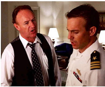
1986 SENS UNIQUE (No way out) de Roger Donaldson avec Kevin Costner