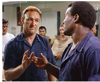
1968 LA MUTINERIE (Riot) de Buzz Kulik avec Jim Brown