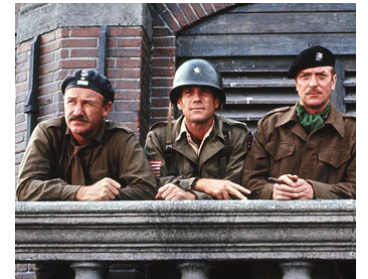
1977 UN PONT TROP LOIN (A Bridge too far) de R. Attenborough avec R. O'Neal, M. Caine