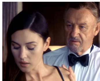
1999 SUSPICION (Under Suspicion) de Stephen Hopkins avec Monica Bellucci