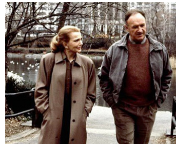
1988 UNE AUTRE FEMME (Another Woman) de Woody Allen avec Gena Rowlands