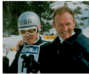
1968 LA DESCENTE INFERNALE (Downhill Racer) de Michael Ritchie avec Robert Redford