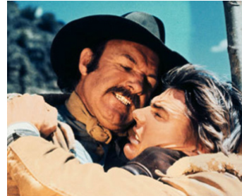
1974 LA CHEVAUCHÉE SAUVAGE (Bite the Bullet) de Richard Brooks avec Jan-Michael Vincent