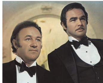
1975 LES AVENTURIERS DU LUCKY LADY (Lucky Lady) de S. Donen avec Burt Reynolds