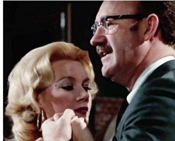
1973 CONVERSATION SECRÈTE (The Conversation) de Francis Ford Coppola avec Elizabeth MacRae