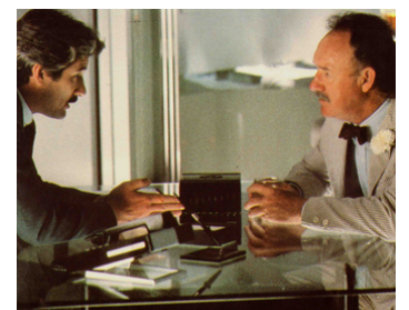
1985 LES COULISSES DU POUVOIR (Power) de Sidney Lumet avec Richard Gere