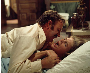
1970 LES CHAROIGNARDS (The Hunting Party) de Don Medford avec Candice Bergen