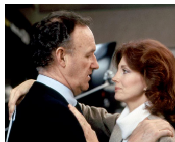
1985 LA CIBLE (Target) d'Arthur Penn avec Gayle Hunnicutt