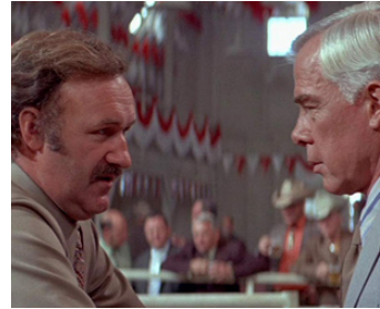
1971 CARNAGE (Prime Cut) de Michael Ritchie avec Lee Marvin