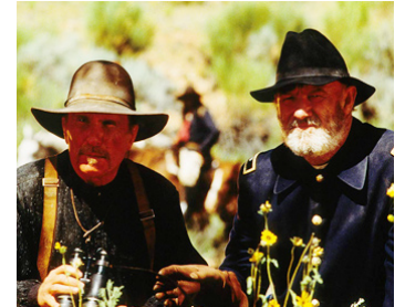
1993 GERONIMO (Geronimo, an american legend) de Walter Hill avec Robert Duvall