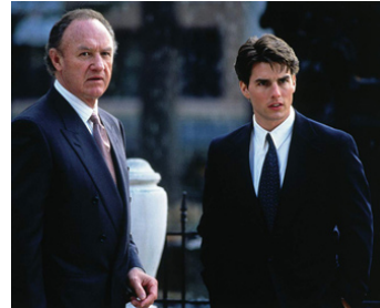
1992 LA FIRME (The Firm) de Sydney Pollack avec Tom Cruise