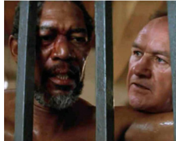
1991 IMPITOYABLE (Unforgiven) de Clint Eastwood avec Morgan Freeman